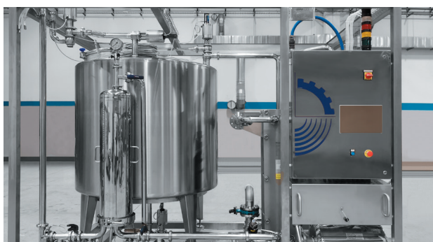
Impianti di trattamento del liquido di governo