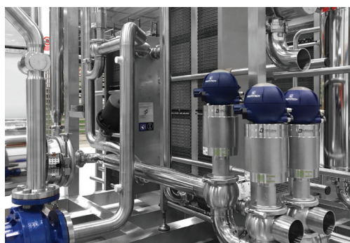
Impianti di trattamento termico HTST