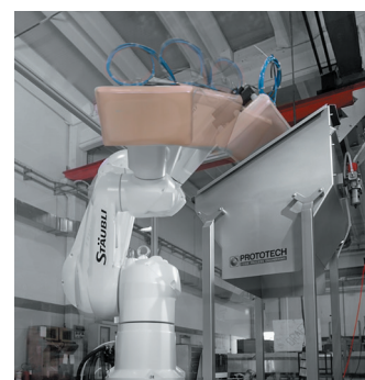
Tecnologia Robotica per il settore caseario

La nostra mission è quella di essere partner di riferimento nell'ingegneria dei processi alimentari , offrendo soluzioni innovative, efficienti e personalizzate che supportano i clienti nell'ottimizzazione della produzione alimentare. Prototech si avvale di tecnologie avanzate e sostenibili, contribuendo a migliorare la qualità e la sicurezza dei prodotti, riducendo al contempo l'impatto ambientale. Prototech accompagna i propri clienti in ogni fase del processo , dalla progettazione alla realizzazione e manutenzione degli impianti, garantendo un'assistenza completa e soluzioni su misura per ogni specifica esigenza .